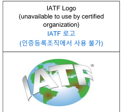
< Pictue 3 그림 3 >