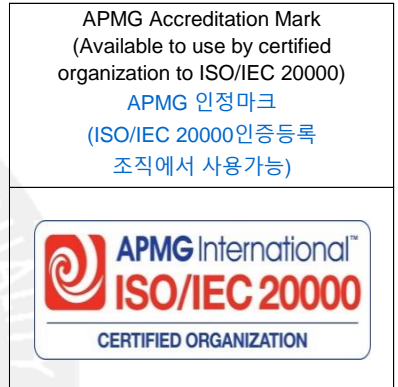
< Pictue 6 그림 6 >