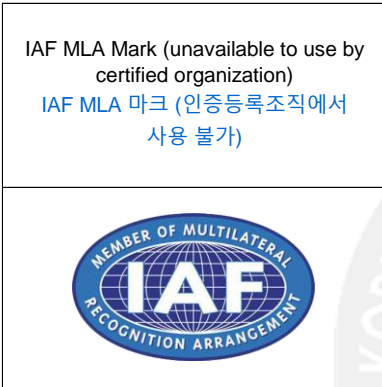
< Pictue 4 그림 4 >