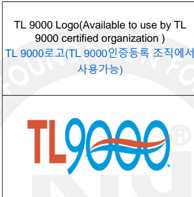
< Pictue 5 그림 5 >