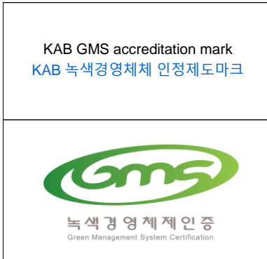
< Pictue 2 그림 2 >