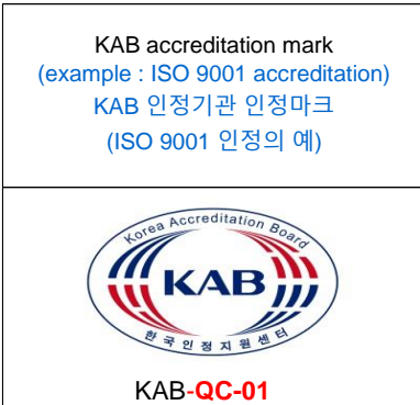
< Pictue 1 그림 1 >