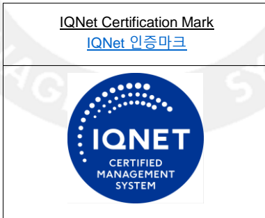
< Pictue 8 그림 8 >