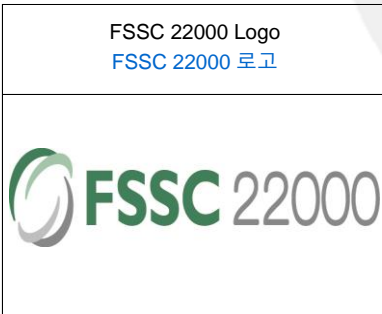
< Pictue 7 그림 7 >